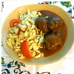
Schwina Bagla (joutes de porc)