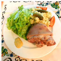
Schwina Haxla (jarret garni)