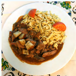
Surlawerla (foie sauté maison)