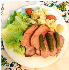
Schiffala (palette fumée)