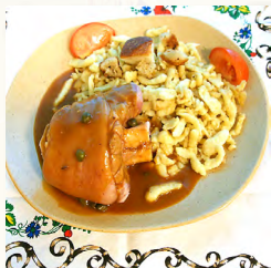
Schwina Haxla (jarret knepfla)