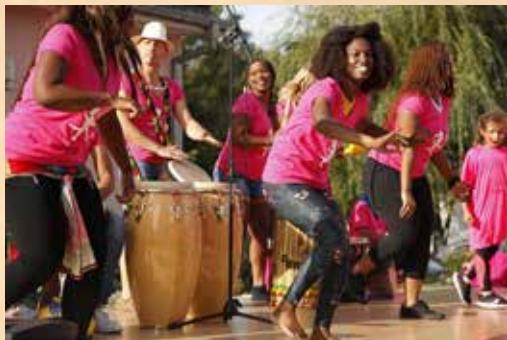
les Cigognes des Caraïbes