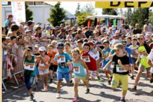
Course à obstacles des Loupiots